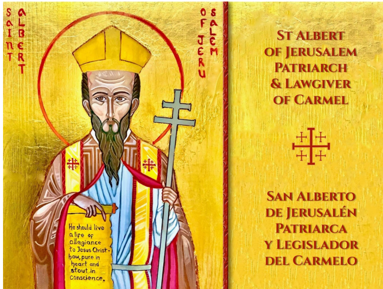
– Written by Br. Filiberto Oregel, O.Carm.

https://www.carmelites.org.au/item/1025-celebrating-st-albert-of-jerusalem .