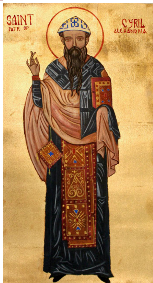
St. Cyril of Alexandria

– Written by Br. Filiberto Oregel, O.Carm.